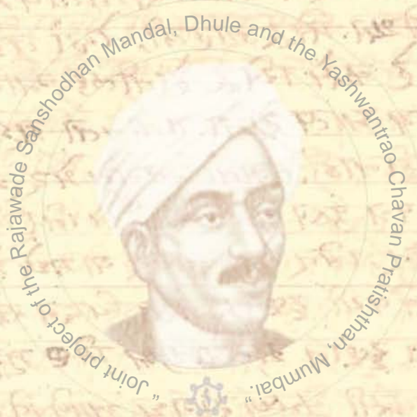
Joint project of the Rajawade Sanshodhan Mandal, Dhule and the Yashwantrao Chavan Pratishthan, Mumbai.

[Faded handwritten text in Devanagari script, likely bleed-through from the reverse side of the page.]